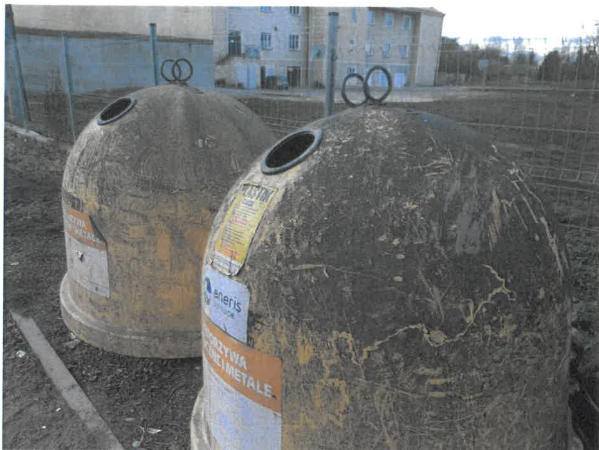
Fotografia nr 1