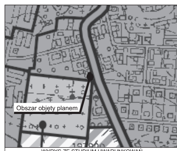
Obszar objęty planem

POŚWIADCZENIE Poświadczam, że niniejszy dokument został opracowany w oparciu o prace geodezyjne i kartograficzne, których rezultaty zawiera operat techniczny wpisany do ewidencji materiałów państwowego zasobu geodezyjnego i kartograficznego. STAROSTA ŚWIDNICKI Dział Inżynierii i Planowania Przestrzennego ul. Piłsudskiego 10 58-100 Świdnica NIP: 780-100-1000 REGON: 141810001 KRS: 0000141810001 Data: 13.05.2014 Wzrost: 1,80 m Waga: 75 kg