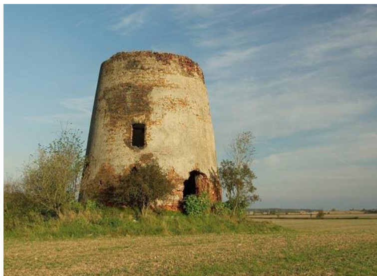
Ryc.6. Ruiny wiatraka

Budowla wieżowa, zwana popularnie "Holendrem", wybudowana została w 2 poł. XVIII wieku. Na murowanym, nieruchomym korpusie wiatraka założonym na planie koła spoczywała obracana kopuła dachu o podstawie kołowej, obracająca się na łożysku posadowionym na oczepie wieńczącym ściany u góry. Zdolność obrotu "czapy" dachu o 360 stopni pozwalała na ustawianie powierzchni skrzydeł prostopadle do kierunku wiatru. Obecnie zachowane są jedynie mury wiatraka i zalegające wewnątrz koło młyńskie.