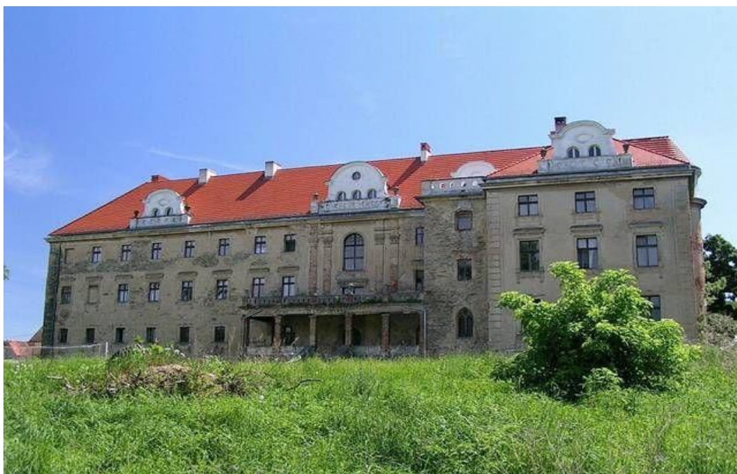
Ryc.2. Pałac w Pyszczyne

Wewnątrz pałacu zachowała się reprezentacyjna barokowa klatka schodowa: schody z białego marmuru, masywna balustrada, sufit ozdobiony stiukowymi dekoracjami. W niektórych pomieszczeniach na piętrze przetrwały stropy fasetowe z dekoracją sztukatorską. Część dawnej świetności zachował salon na piętrze, w którym znajduje się m. in. kominek z białych kwadratowych kafli, bogato dekorowanych ornamentem barokowym. W innym pomieszczeniu na piętrze baszty zachował się klasycystyczny piec z białych, kwadratowych kafli.