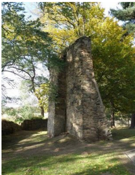
Ryc.5. Murowana strzelnica

Strzelnica została wzniesiona w 2 poł. XIX w. (ok.1882 r.). Jej ściana wymurowana jest z nieregularnego kamienia, wsparta dwiema ukośnymi przyporami. Zlokalizowana przy kaplicy mszalnej.