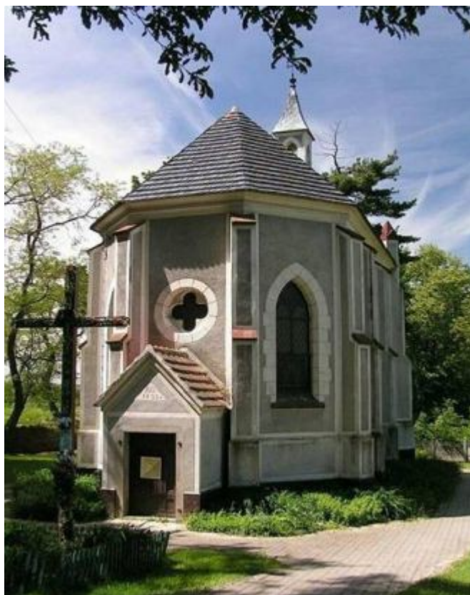
Ryc.4. Kaplica mszalna pw. św. Antoniego