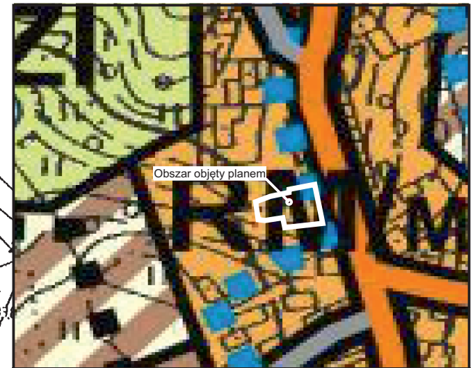
WYRYS ZE STUDYUM UWARUNKWAŃ I KIERUNKÓW ZAGOSPODAROWANIA PRZESTRZENNEGO GMINY ŻARÓW