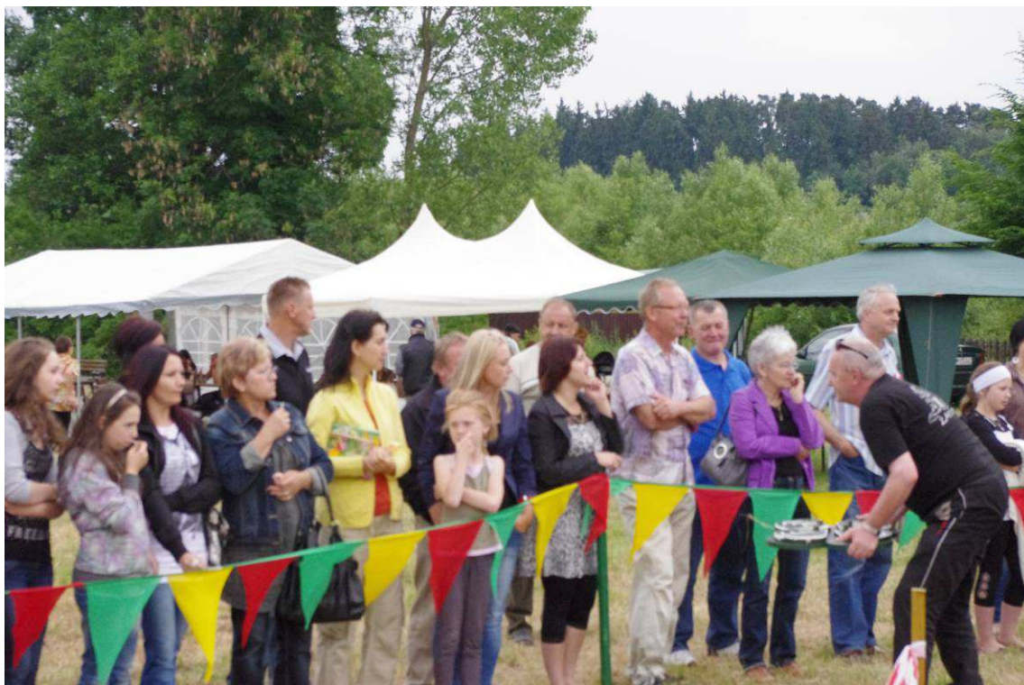
Wiosenne porządki 2011r.